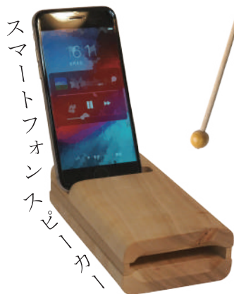
スマートフォンスピーカー