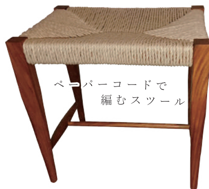
ペーパーコードで編むスツール