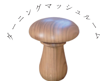
ダーニングマッシュルーム