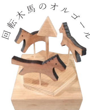
回転木馬のオルゴール