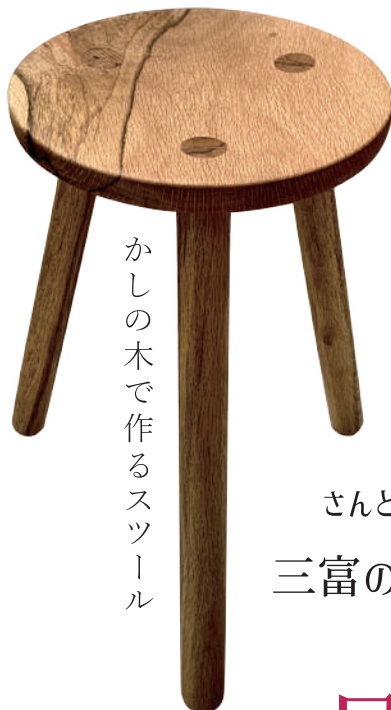
かしの木で作るスツール